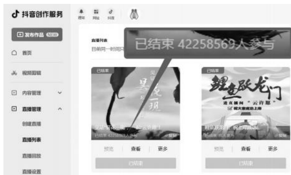
图1：“金蝉视频”抖音后台截图 单场慢直播人气4000万+

的仰拍角度，从而将含苞待放的昙花在蓝天白云下迎风摇曳的感觉展现了出来。为了保持美感，我们需要持续关注天气和光照变化，及时调整设备曝光。明朗的午后，伴随着动听的国风音乐，开播仅一个小时就涌入10万多观众，纷纷评论点赞这美妙的意境。这场慢直播的数据最终突破4225万+（图1），成为“金蝉视频”慢直播“单场人气王”。