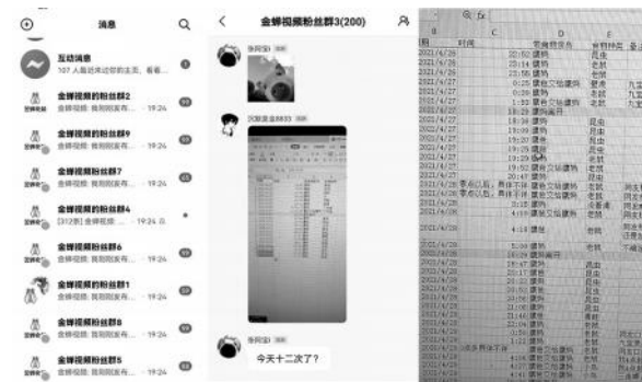
图2：“金蝉视频”粉丝群列表及部分群聊信息