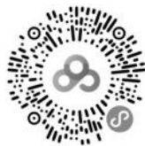
“猫头鹰孵化记”慢直播