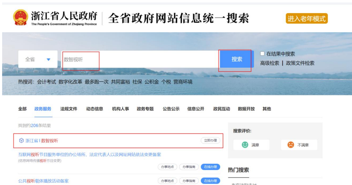
图 1 数智视听应用搜索