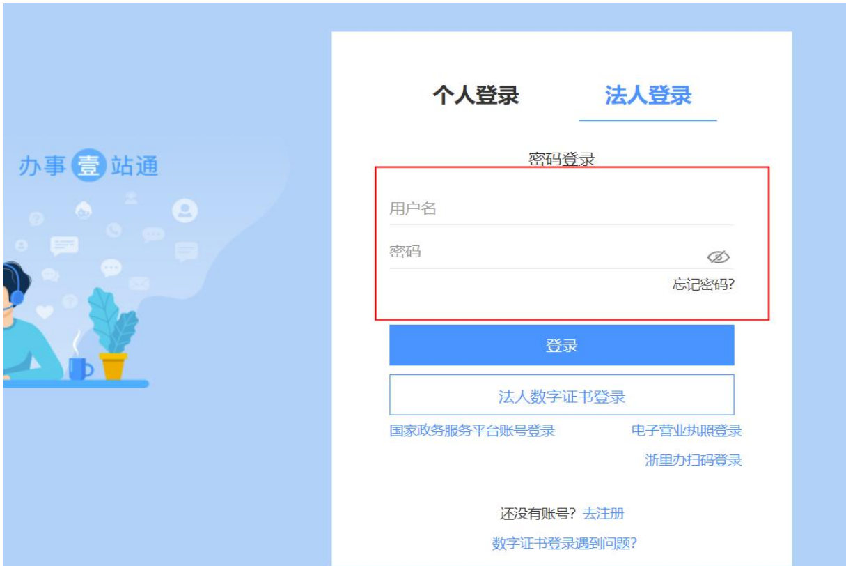
图 3 法人登录