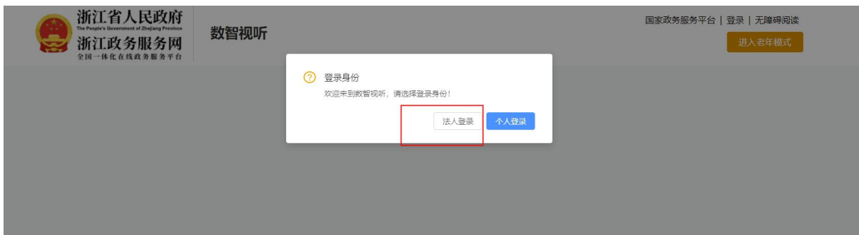
图 2 数智视听应用登录提示