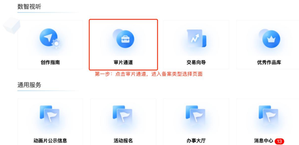
图 4 审片通道