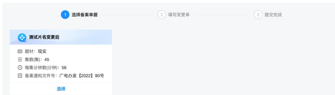
图 15 动画片变更选择