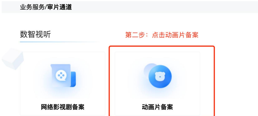
图 5 动画片备案入口