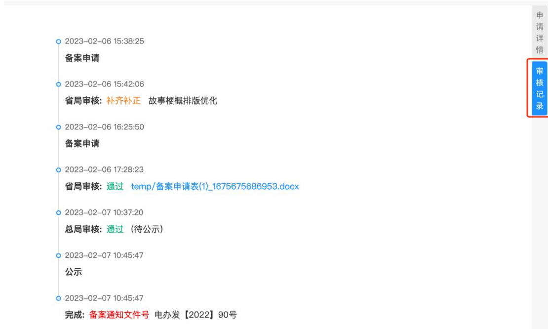
图 14 动画片备案审核进度